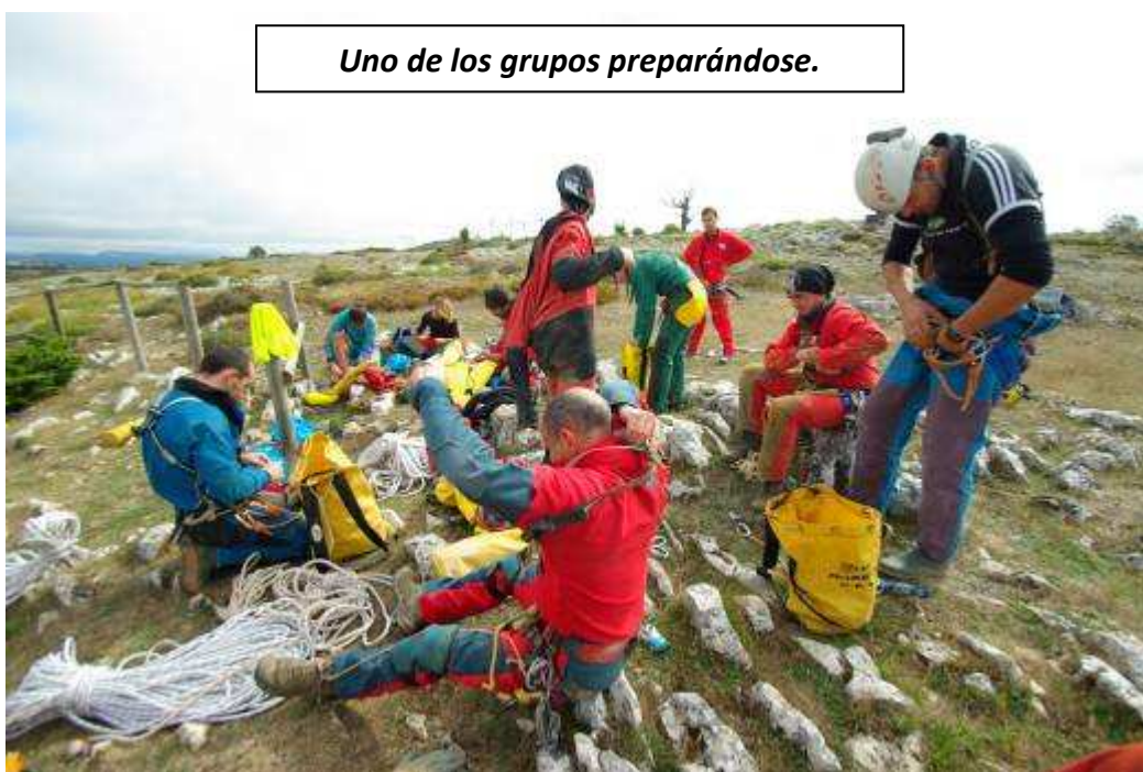
Uno de los grupos preparándose.

Tras la cena (algunos grupos llegaron con retraso) se proyectó el documental “A través de la Piedra” doblado del francés por el G. E. Niphargus; narra de manera amena una travesía deportiva en el Sistema de La Piedra San Martín, en los Pirineos, a caballo entre España y Francia.