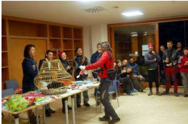
El sorteo (sin comentarios).