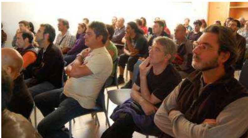
En ambas conferencias se llenó por completo la sala.

Apoyándose en una presentación fotográfica comentada y desarrollada, no asistimos a una conferencia al uso, sino a un diálogo donde todos aprendimos de forma amena y se derribaron falsas y extendidas creencias. Destacar lo "efímero" (en términos geológicos) de las cavidades volcánicas, su rápida formación, y las complejidades geomorfológicas que se derivan de ello. También nos dio una completa visión de cómo es la Espeleología en las zonas volcánicas en general y en las Islas Canarias de modo particular.